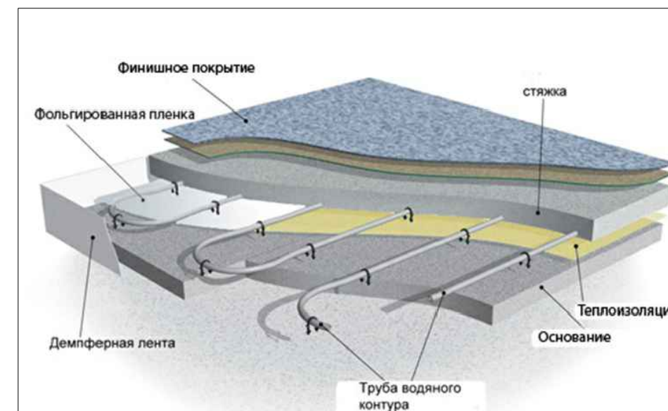
Спецификация напольного отопления